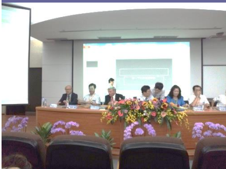
2015 仲夏的饗宴學生輔導與學校 諮商學術研討會-法理、挑戰與願景 Dr. Norman Gysbers 嘉義大學 2015 年 7 月 13 日