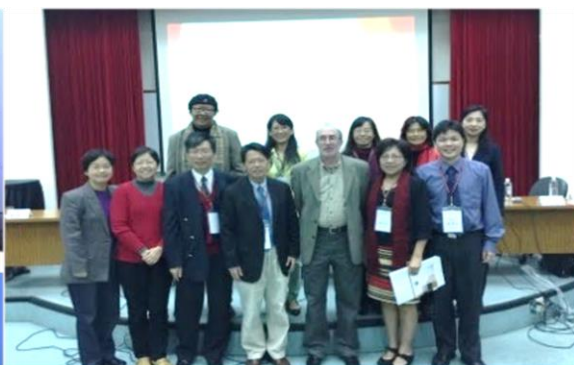
2015 師資培育新趨勢與挑戰：國際學術研討會